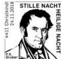
Stempel 24.11.2018 „Stille Nacht“ (34mm x 34mm)