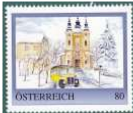
personalisierte Marke Sonderpostbeförderung 2018 limitierte Auflage