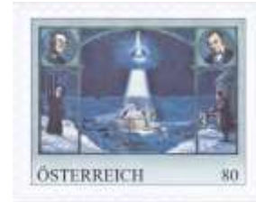
personalisierte Marke Sonderpostamt Christkindl 24.11.18 „Stille Nacht, Heilige Nacht“