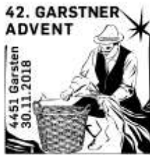
Stempel 30.11. und 1.12.2018 (34mm x 34mm)

Aufgrund der neuen Datenschutzverordnung ist es seit 25.5.2018 notwendig, dass Sie der Zusendung von Daten per Post oder per E-Mail zustimmen. In der beiliegenden Bestellliste ist der entsprechende Passus angeführt.