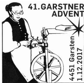
Stempel am 1. und 2.12.2017 (37mm x 38mm)