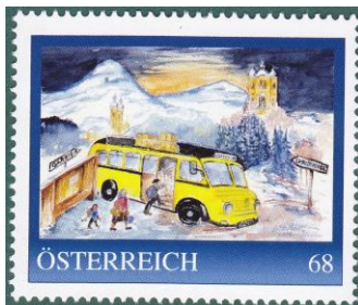
personalisierte Marke für die Sonderpostbeförderung 2017 limitierte Auflage