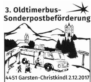
Stempel zur Sonderpostbeförderung 2.12.2017 (37mm x 38mm)